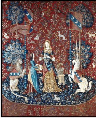
Tapiserie, La dame à la licorne 1500-1510)

Comparez les tableaux en utilisant des comparatifs plus, moins, ou aussi (pour comparer les adjectifs) ou plus de, moins de, ou autant de (pour comparer les noms)