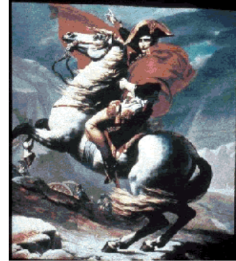
Louis David, Napoléon (1800)