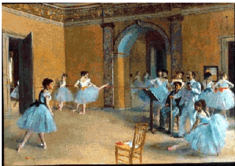
Edgar Degas, Répétition sur la scène (1874)