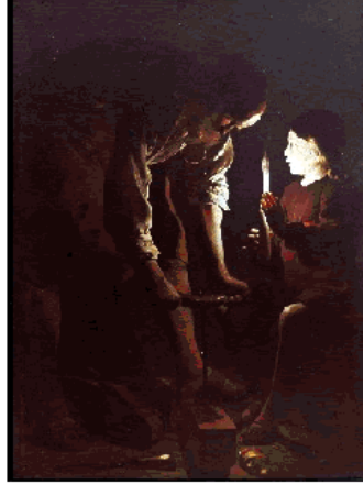
Georges de la Tour, Saint-Joseph (ca. 1654)