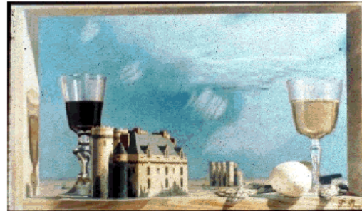
Pierre Roy, Une journée à la campagne (ca. 1925)